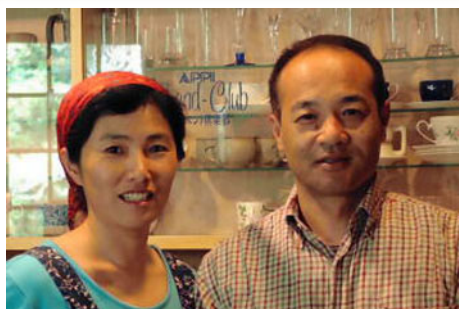
「自家焙煎珈琲と手作りのおもてなし」