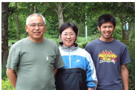
「家族4人で暖かいおもてなし」