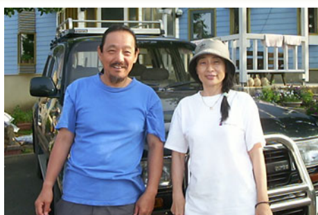
「オーナーシェフが作る暖かいおもてなし料理」