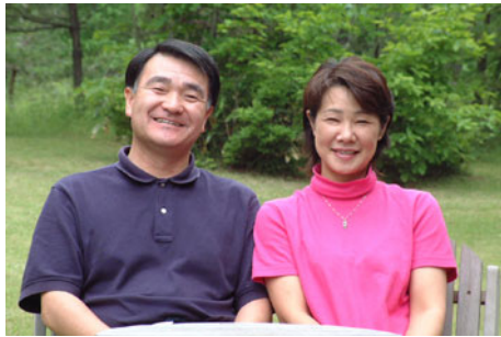
「美味しさ」と「おもてなしの心」