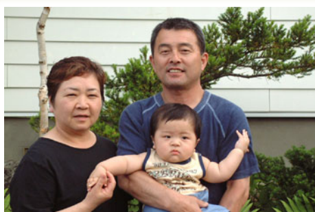
「旬の食材、地場食材」