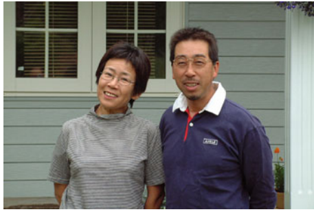
「林檎のぬくもりを実感してみませんか」