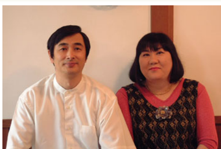
「お客様に小さな驚きと感動を与えるお店でありたい」