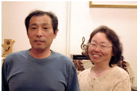
「アットホームで楽しいペンション」